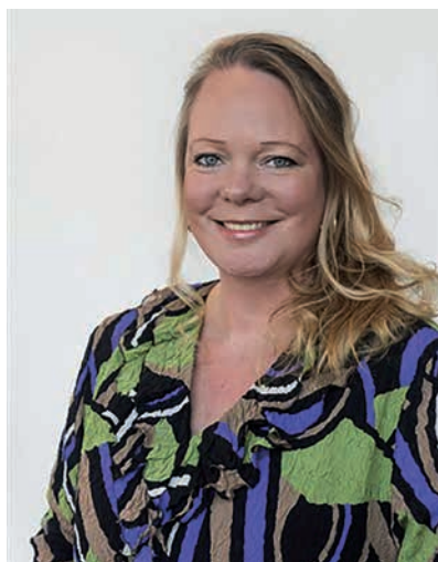
Hester Maij Gedeputeerde provincie Overijssel

De LEADER regeling bestaat inmiddels ruim 25 jaar in Nederland en richt zich op het versterken en verder ontwikkelen van de leefbaarheid en de economie op het platteland. Door het initiatief voor het aandragen van LEADER projecten aan bewoners zelf te laten, hebben we de afgelopen jaren veel mooie projecten en initiatieven tot stand zien komen. Veelal gaat het daarbij om kleinschalige initiatieven, die voor structurele versterking van de regio's zorgen. Hierbij valt te denken aan projecten op het gebied van economie, leefbaarheid, landschap of toerisme.