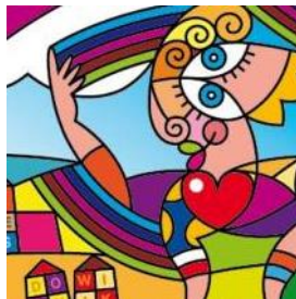
Kern met Pit voor de buurt