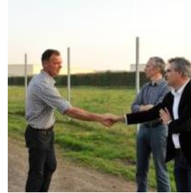
KNHM Participaties BV voor bewonersbedrijven