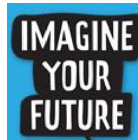
Artcadia voor jongeren