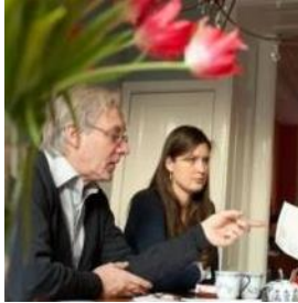
KNHM Advies voor burgerinitiatieven