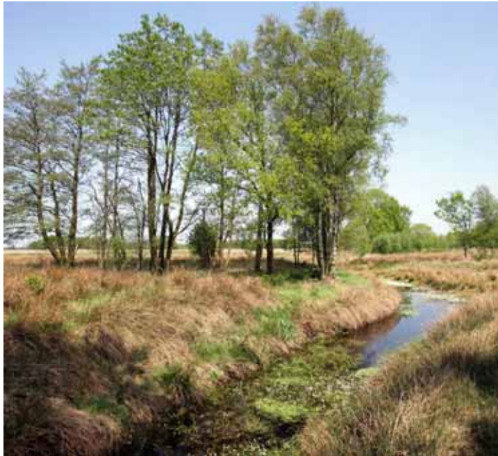
Herstel uniek cultuurlandschap (Drenthe)

In juni 2006 heeft een consultatiebijeenkomst plaatsgevonden, waarvoor alle relevante maatschappelijke organisaties waren uitgenodigd. Tijdens deze bijeenkomst is een presentatie over het Plattelandsnetwerk gegeven en is uitgebreid gediscussieerd over alle assen en keuzes, die gemaakt zijn voor de in Nederland in te zetten POP-maatregelen. In oktober 2006 heeft een schriftelijke consultatie plaatsgevonden over het eindconcept van het Programmadocument POP2. Maatschappelijke organisaties, belangengroepen, waterschappen en gemeenten is expliciet verzocht om op het concept te reageren en daarnaast is via de website van het Regiebureau POP aan alle belangstellenden de mogelijkheid geboden hun visie te geven.